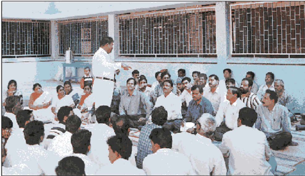
परस्पर संपर्क प्रशिक्षण सत्र

संस्थान ने कई मॉड्यूलों/मैनुअलों को तैयार तथा प्रकाशित किया है यथा सामाजिक सौहार्द्र तथा राष्ट्रीय एकता, शिक्षको हेतु कैरिअर मार्ग-दर्शन, किशोरों हेतु जीवन कौशल, लैंगिक समानता तथा युवा, आदर्श युवा क्लब, नेतृत्व तथा व्यक्तित्व विकास, सामाजिक एनीमेटर के रूप में जनजातीय युवा, नागरिकता अधिकारों तथा साम्प्रदायिक सदभाव में युवाओं का प्रशिक्षण, सीमावर्ती जिलों में युवा और एनएसएस प्रशिक्षण मैनुअल शामिल हैं ।