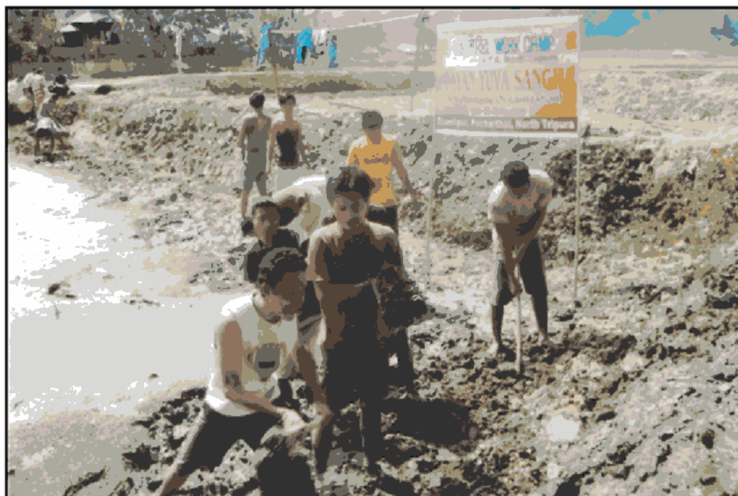
नेहरू युवा केन्द्र (एन.वाई.के.), उत्तरी त्रिपुरा का श्रमदान शिविर

नेहरू युवा केन्द्र संगठन (एनवाईकेएस) युवा कार्यक्रम एवं खेल मंत्रालय का एक स्वायत्तशासी निकाय है। एनवाईकेएस के 501 केन्द्र, 28 क्षेत्रीय कार्यलय और 3.05 लाख से अधिक ग्राम स्थित युवा क्लब हैं जिसमें लगभग 8 मिलियन स्वयं सेवक पंजीकृत हैं। एनवाईकेएस का वर्तमान योजनावधि के दौरान देश के शेष 122 नए जिलों में विस्तार किए जाने का प्रस्ताव है। यह सबसे बड़ा बुनियादी स्तर का स्वैच्छिक संगठन है जोकि अपने प्रकार का विश्व में एकमात्र है। यह 13-35 वर्ष के आयु समूहों वाले युवाओं की शक्ति को स्वयं सेवा, स्व-सहायता तथा भागीदारी के सिद्धांत पर चैनलबद्ध करता है।